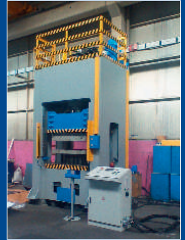
Sheet metal processing

E-Mail: info@atm-group.de Homepage: www.atm-group.de